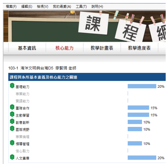
圖3-3-1二門不同教師「海洋文明與台灣」課程之培育核心能力與基本素養權重一致