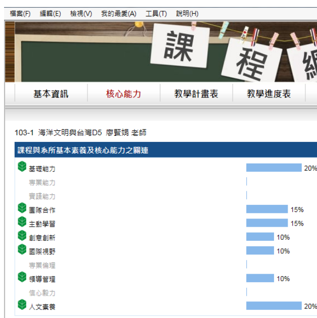
圖3-3-1二門不同教師「海洋文明與台灣」課程之培育核心能力與基本素養權重一致