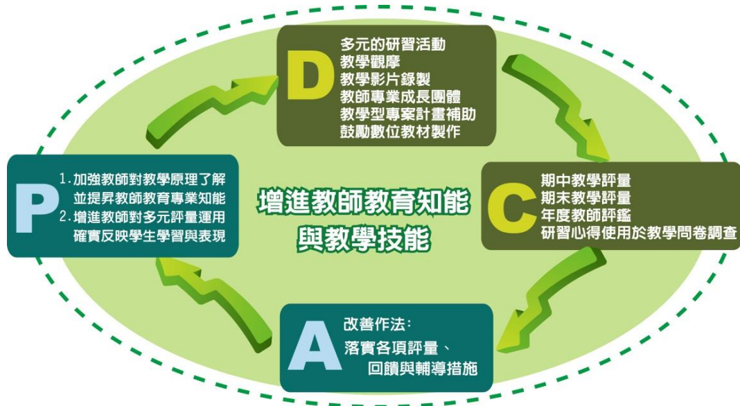
圖3-3-2大葉大學增進教師教育知能與教學技能的PDCA機制

100學年為提供更多「教」與「學」資源，本校成立「教學資源中心」，作為協助教師教學成長的單位。該中心負責辦理教師專業教學成長相關活動以及豐富學生學習資源等業務。通識教師均需配合全校的政策實施相關措施。本校辦理教師專業教學成長的特色作法，以及建置增進教師教育知能與教學技能的PDCA機制如下圖3-3-2所示，重點措施說明如下。