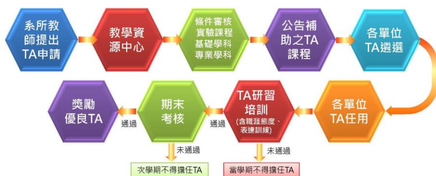
圖 3-3-3 大葉大學教學助理（TA）實施流程圖

巧、YouTube雲端影音之應用、Word 2010長文件的排版、數位影音剪輯與製作、我如何與大學生互動、Excel 2010資料處理與應用、成績比對分析技巧等。表3-3-3為100學年-103-1學期教學助理（TA）配置統計表。