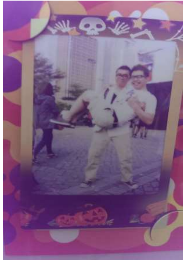
◎去年台北同志大遊行，我及男友勇敢走上街頭曬恩愛。

從馬英九上任台北市長實現他的承諾，讓同志團體在台北市舉辦同志大遊行以來，已經舉辦將近十屆，各地方紛紛響應，高雄、台中也都有屬於自己的同志遊行，我參加過台北的同志大遊行 4-5 次，高雄的同志遊行也參加過 1 次，今年 5 月將在台中舉辦的同志遊行，我也打算出席，用行動表示對於多元成家草案的支持。我是個還沒出櫃的膽小鬼，為了這次的公民評論，我豁出去啦！我是同志！我支持多元成家草案！如果你身邊有要好的同志朋友，別緊張，不需要跟他斷開魂結與鎖鏈，我們需要的，只是你們友好的態度，這樣，即使多元成家草案，還需要很多的努力，我們仍會感受到社會的溫暖，只要大家對於同志能有更多的包容與同理心，相信多元成家草案的通過，是時間遲早的問題罷了！