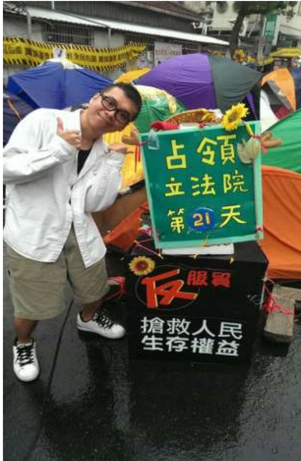
◎雖然不是撰寫太陽花學運，但我可是有以實際行動來表示支持呢！